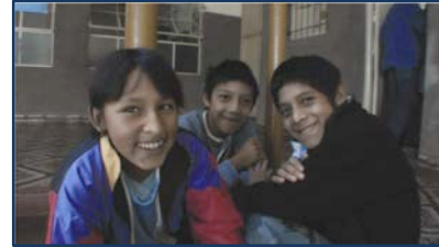
Escuela de la Misión Franciscana