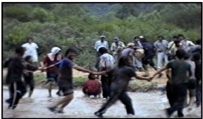
Celebración de la cosecha