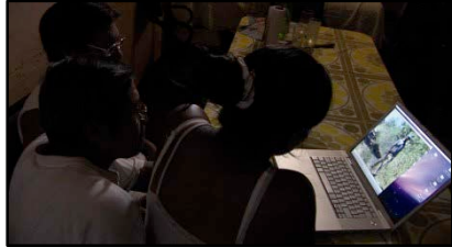
Los recuerdos de Celina