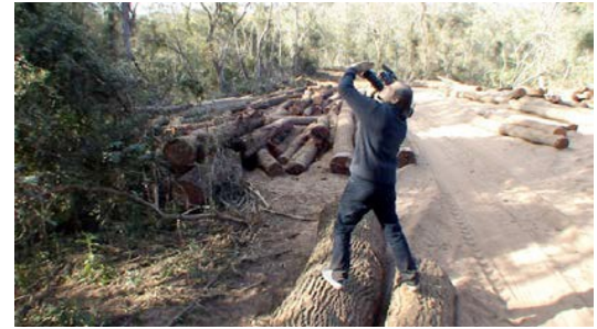
El monte de Facundina se va perdiendo