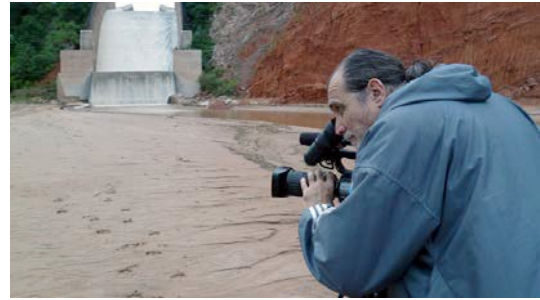
Buscando la imagen en el dique