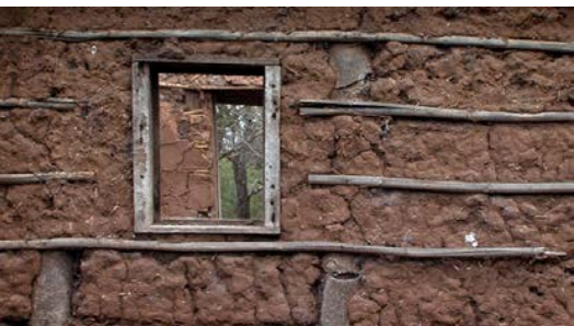
🗡️ cuantas casas hemos hecho?