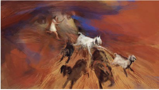
¡ pa'donde yo iba, ahí tenía que estar él!