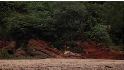
esperando al Candelario