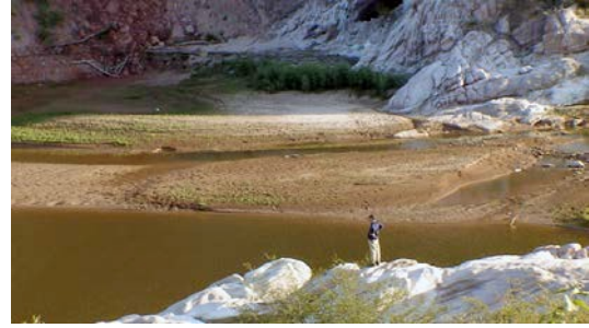
Buscando los caminos de Facundina