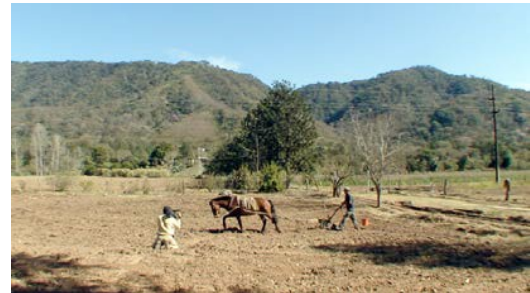
En el cerco