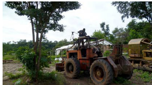
Eh...! Francezón? ...quieres un dolly?