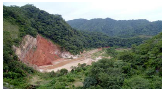
Escenario de Facundina y Candelario