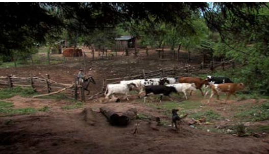
“allá tenían de todo mis hijos”