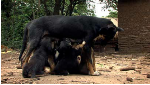
“uffff!... he peleado mucho a la vida 🗡️”